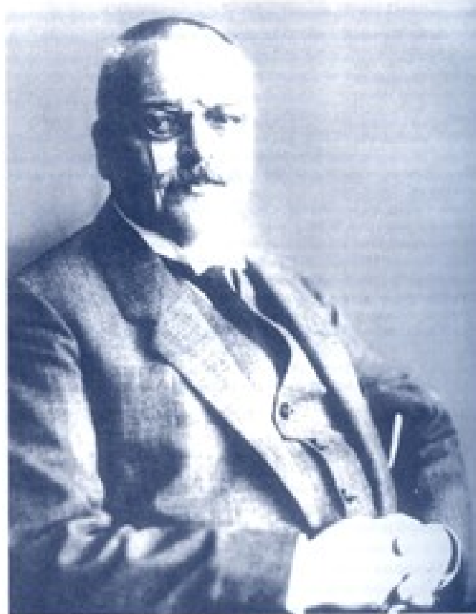
Alois Alzheimer, 1864-1915