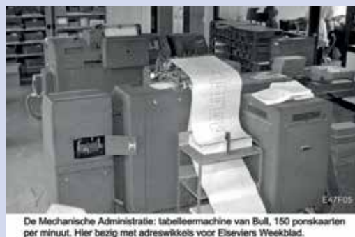
De Mechanische Administratie: tabelleermachine van Bull, 150 ponskaarten per minuut. Hier bezig met adreswikkels voor Elseviers Weekblad.