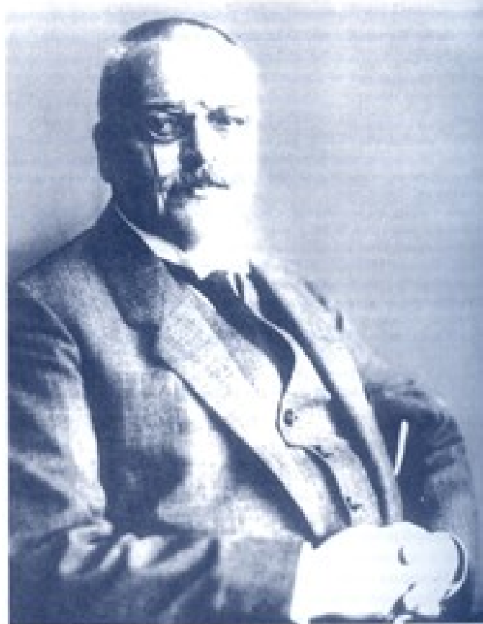
Alois Alzheimer, 1864-1926